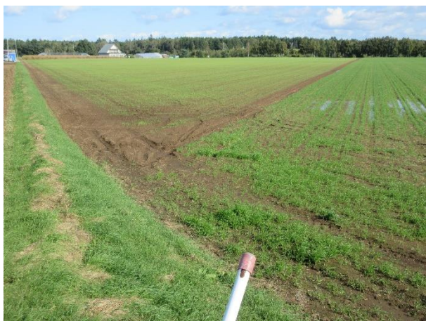
一般小麦跡のエン麦（左）と秋播小麦（右）