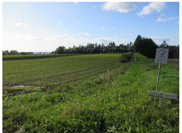
有機 JAS 圃場のエン麦